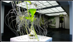
filmstills Feuerstein im Kunstverein

Aus dem weiten Spektrum wurden u.a. gehoben: Sechs Skulpturen Georg Kolbes . Von Adam über den Ring der Statuen, Beethoven- und Heinedenkmal bis zur Verkündung.