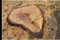
Foto Baumfall Adlerfluchtstraße