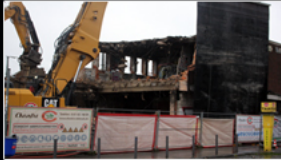
Abbruch Ostbahnhof 2023

Geflechte aus Trampelpfaden, Wasserläufen, Asphaltbändern, Schienen und Betonrinnen. Datenautobahnen und Lufthoheit.