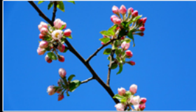
filmstill Apfelblüte am Steinberg

Als die Stadt noch keine Stadt war, war Alles Natur. Der Stadtraum bestand aus Bakterien, Erde, Wasser, Pflanzen, Insekten, Vögel und Fische und Vierbeiner. Sie bauten Nester, Höhlen, suchten Unterschlüpfе.