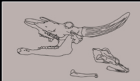
Zeichnung Auerochse und Hund

Die ältesten Zeugnisse finden sich in Naturkundemuseen. In Frankfurt wenige Knochen eines Auerochsen mit Hund, keltische und römische Scherben, aus dem Mittelalter vier, fünf, sechs Türme und eine verstümmelte Stadtmauer. Fachwerkhäuser, neuzeitliche barocke Paläste, genauer : zwei und Gesellschaftshäuser. Manches verschwindet wieder. Das Meiste verschwindet.