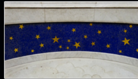
Foto Hauptfriedhof/ Gruftenhalle

Vom Weltraum aus betrachtet, ist unser Sonnensystem winzig; unser Planet Erde noch winziger und die Stadt Frankfurt am Main kaum zu erkennen.