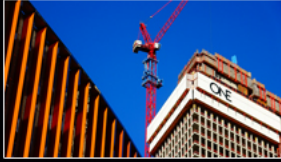
filmstills Zwischen Lia Wöhr- und Güterplatz

Damit dem menschlichen Gehirn nicht langweilig wurde, ersann es vielfältige Tätigkeiten, darunter auch Tätlichkeiten, die den Menschen fortwährend beschäftigen.