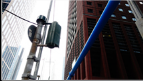
filmstill Große Gallasstraße