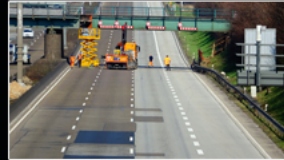
Sperrung Autobahn bei Rödelheim 2022