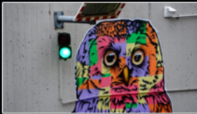
streetart Eulen an der Musterschule

„Hydra“ von Thomas Feuerstein im Frankfurter Kunstverein und Eulen an der Musterschule.